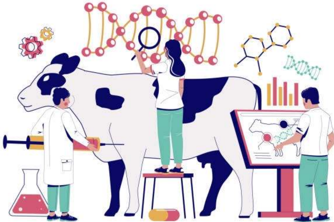
GENETICALLY MODIFIED ANIMALS